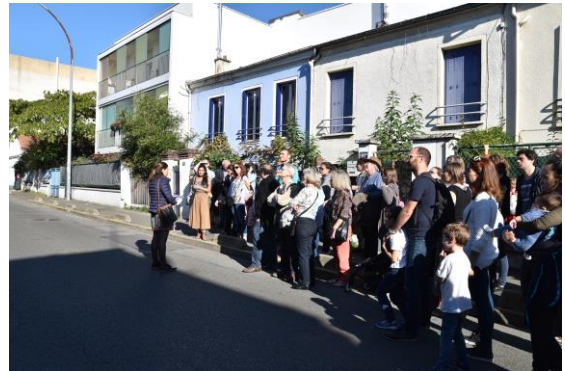
Balade urbaine organisée à Montreuil - 2017

Les 19 et 20 octobre , les architectes ouvriront simultanément les portes de l'architecture au grand public. Des rencontres inattendues et un accueil personnalisé attendent amateurs d'architecture, partenaires des architectes et néophytes, sur l'ensemble du territoire. Autant de lieux que de personnalités, de tailles d'agences, de modes de fonctionnement et de types de projets à découvrir. Retrouvez les agences qui participent à cet événement sur le site dédié . Il y en a sûrement une près de chez vous !