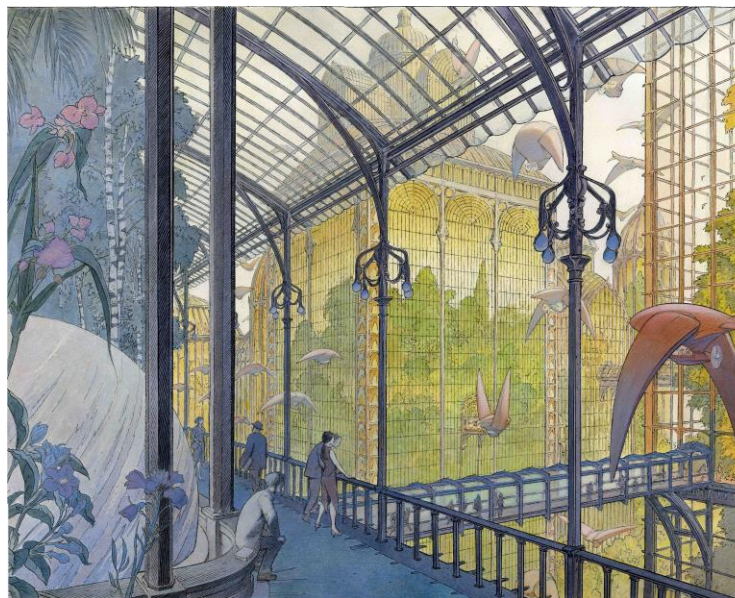
© François Schuiten, la ville-serre de Calvani Image de la couverture du « Livre 1 » de « L'intégrale des Cités Obscures », Casterman, 2017

Cette table-ronde animée par Marine de la Guerrande, architecte et élue ordinale, reviendra sur cette idée que le rêve et l'imaginaire, au travers de la bande dessinée peuvent sensibiliser à l'architecture, nous interroger