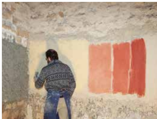
Différentes finitions en enduit chaux-chanvre