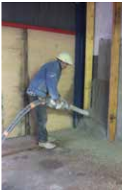
Projection de béton de chanvre

Appliqué en plancher, en mur et en toiture, le béton de chanvre permet de réaliser des bâtiments très basse consommation avec un coût carbone répondant aux enjeux du réchauffement climatique.