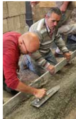
Dalle isolante en béton de chanvre