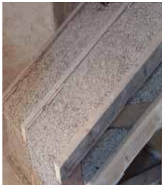
Isolation de toiture en béton de chanvre