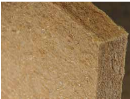
Panneau de laine de chanvre

Ci-dessous la pose d'une laine de chanvre en rouleau en isolation d'un mur intérieur étanche à l'air. La chènevotte en vrac s'utilise pour isoler les combles, les planchers et le doublage intérieur des murs.