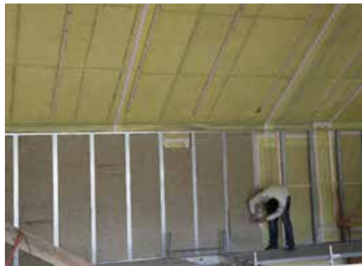
Pose de panneaux de laine de chanvre