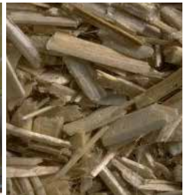
Chènevotte en vrac