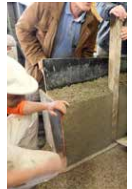
Mur en béton de chanvre banché