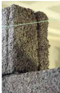
Bloc de béton de chanvre