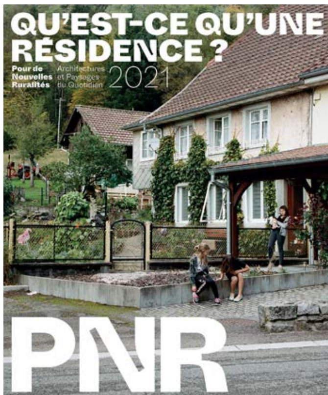
La résidence fera l'objet d'une édition courant 2022